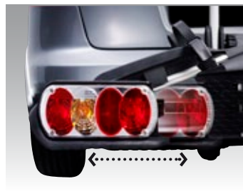
Ausziehbare Felgenhalter und Rücklichter für maximale Flexibilität