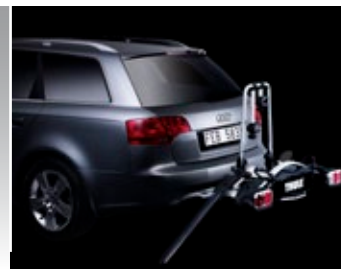
Optionale Laderampe erleichtert die Beladung