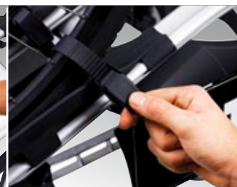
Felgenhalter mit komfortabler Ratschenfunktion mit Schnellverschluss für einfache, schnelle und stabile Befestigung der Räder.