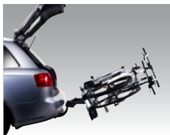
Abklappmechanismus mit komfortablen Fußpedal ermöglicht Zugang zum Kofferraum