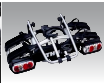
Einfach zusammenklappbar für problemlose Aufbewahrung